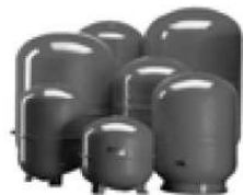
Мембранные баки Cal-Pro