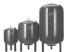
Мембранные баки DE