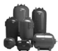
Мембранные баки Ultra-Pro